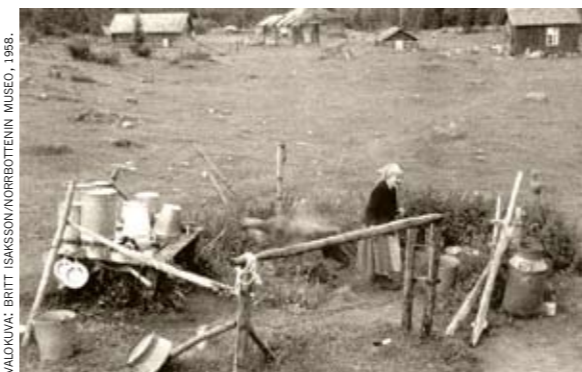
"Plaana", paikka jossako kaikki astiat ja neuvot tiskathiin kiehuale veelä ja katajavispilöilä. Se oli aijotettu niinku pottumaa ja se vainio jokka meinathiin niittä syyskesästä.

ETTEOLLA LYSÄJÄ KENTÄLÄ OLI ARVOSTETTU – TÄÄLÄ SITÄ SAI HENKIRAUHAA ARKIPÄIVÄN REPIMISESTÄ TALOLA. PERJANTAINA TEHTHIIN MAITOTUOTHEET VALHMIIKSI KULJETUSTA VARTEN – NET NOUETHIIN KOTIA TALOLE PÄIVÄÄ JÄLKHIIN.