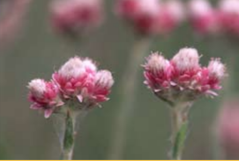
Kattfot, Kissankäpälä, laitun-elikkä kylvönsuosittu.