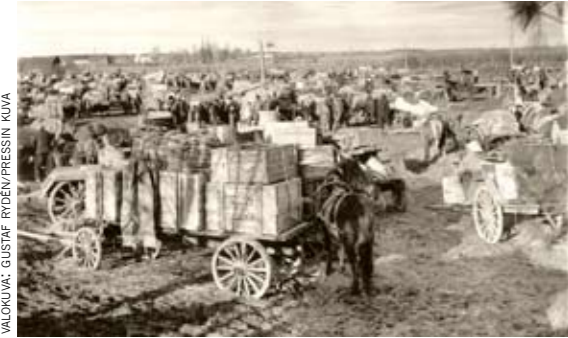
Se iso pakolaisleiri Haaparannala 8 lokakuuta 1944.

EI MIKHÄÄN ASUMINEN ILMAN PUHASTA VETTÄ! KALTIO OLI TÄRKEÄ KENTÄLE, TÄÄLTÄ NOUETHIIN KAIKKI VESI JA TÄÄLÄ JÄHYTETHIIN SE MAITO JOTAKO MEINATHIIN KÄYTTÄÄ VERKESENÄ. KAIVORENKHAAT PANTHIIN TÄNNE 1941, KO YKS MILITÄÄRILEIRI OLI SIOTETTU KENTÄLE.