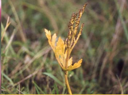
Toppläsbräken, Suikeanoidanlukko, laitun-elikkä kylvönsuosittu ja häviönuhattu.