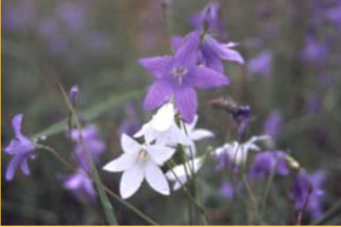
Angsklocka, Harakankello, laitun-elikkä kylvönsuosittu.