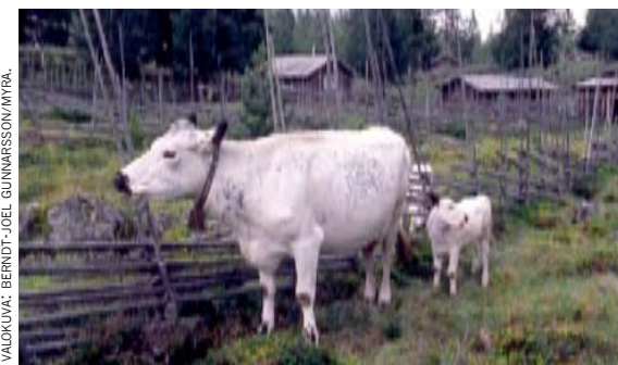
Saattaakos se olla Mansikka, elikkä Mustakorva? Tunturilehmä oli helppohoitonen ja kestävä. Ylheensä sillä ei ollu sarvia – se oli "nuporotunen".

TUNTURILEHMÄ OON OLLU PITKHÄÄN POHJOISRUOTTISSA, LUULTAVASTI 1000-LUVUSTA ASTI. SE OLI SE ERIKOISLUOKKALAISESTI TAVALISIIN LEHMÄROTU, MUTTA 1900-LUVULA SE VAIHETETHIIN MATALAMAAN KARHJAAN. TÄNÄ PÄIVÄNÄ TUNTURILEHMÄ OON HÄVIÖNUHATTU RUOTTISSA.