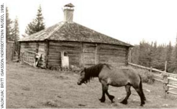
Pohjoisruottalainen Brunte piethiin aitauksessa. Siinä vanhaassa hevosenhaassa kasuaa tänä päivänä muun muassa smörboll, kullero, höstläsbräken, ahonoidanlukko, späd ögontröst, ketosilmäruoho ja yks ja toinen jungfru Marie nycklar, Maariankämme! Valokuva otethiin 1958. Navetta rakenethiin uuesti 2001.

ASUNTOTALO, NAVETTA JA MAITOPUOHI OLIT NET TÄHELISIIMÄT RAKENUKSET KENTÄLÄ. NAVETASSA LEHMÄT PIETHIIN VYÖLÄ, MAITOPUOHI TARJOSI VIILEÄN SÄILYTYSPIIKAN MAIJOLE JA RUALE – YHELÄ NIISTÄ OON ISULERAAVA LISÄSEINÄ KIVESTÄ. OLKAA HYVÄ JA TIRKAKKAA SISÄLE!