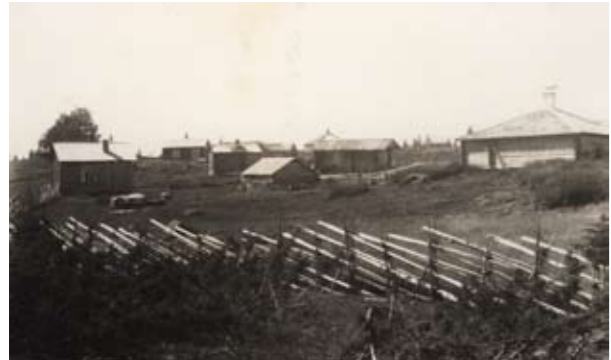
Tavalisuussa muutto kentäle tapahu Salmonpäivänä, 8 kesäkuuta.

VALOKUVA VUELTA 1925: J FRODIN/POHJOLAN MUSEON KUVATOIMISTO